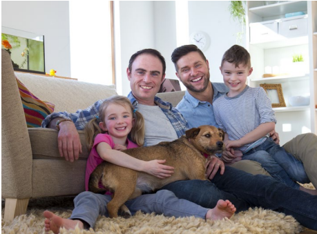
تماس با یک وام دهنده ReCoverCA HBA